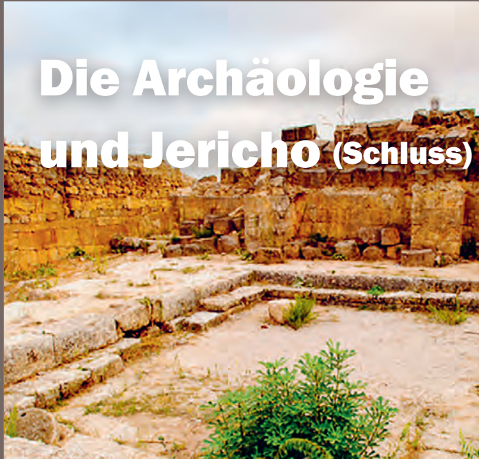
Runnen von Ugarit in Ras Schamra

➔ Zuvor haben wir zwei der vier Themen betrachtet (den Bann und die Frage der Moral), die Klarheit über das umstrittene Handeln Gottes bei der völligen Vernichtung der Einwohner und Tiere Jerichos schaffen. Nun werden wir die beiden letzten Fragen diskutieren, die uns helfen, die ethischen Aspekte dieser Angelegenheit zu akzeptieren, wenn wir sie vielleicht auch nicht vollkommen verstehen.